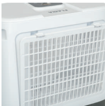
Filtro de ar lavável e removível