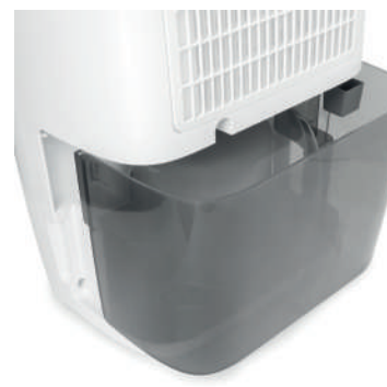
Depósito de 2,8L